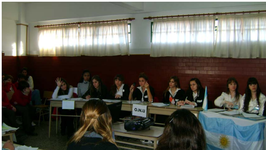
Dramatización de una sesión en la ONU con el comité de Descolonización, delegaciones del Gobierno Argentino, Británico, Kelpers y periodistas.